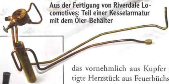
Aus der Fertigung von Riverdale Locomotives: Teil einer Kesselarmatur mit dem Öler-Behälter