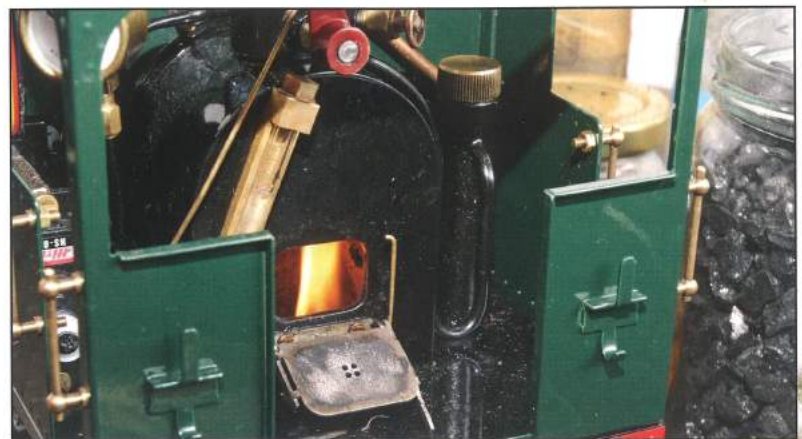
Angefeuert wird mit getränkter Holzkohle; ein Lüfter auf dem Schlot sorgt dafür, dass das Feuer sich gut ausbreitet und sorgt anfangs für jede Menge Qualm, der sich aber bald verzieht, wenn echte Kohle ins Spiel kommt.