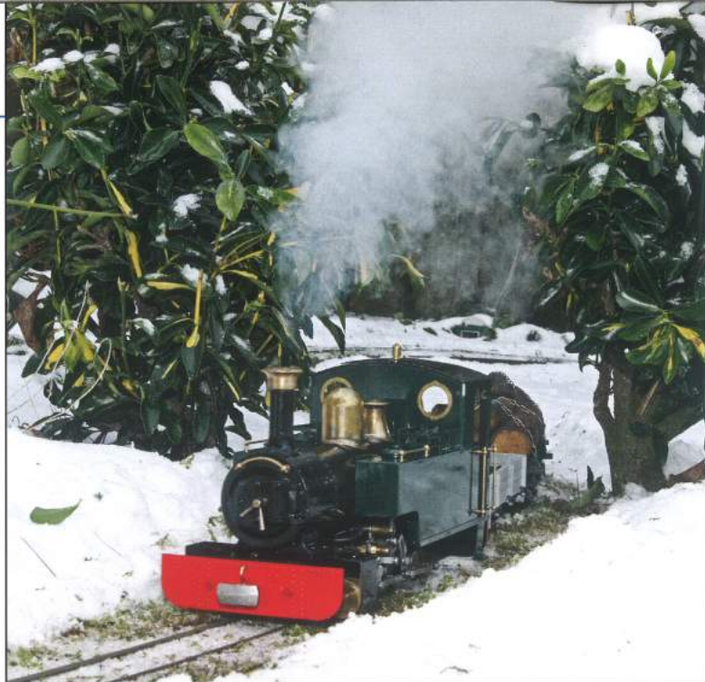
Auch nach über einer halben Stunde fährt Amy wie in der ersten Minute – unter Vollampf, obwohl während der Fahrt keine Kohle nachgelegt wurde.

Pump-Pause, Klappe auf – ein Blick aufs Feuer und wieder wandern ein paar Stückchen Kohle in die Feuerbüchse. Fette Kohle steht heute auf dem Speiseplan der Lok, auf den Verbrauch achten wir mal nicht. Wir wollen mächtige Dampffahnen in die kalte Winterluft schreiben, und blicken gemeinsam erwartungsfroh auf das Manometer von Elke, der kleinen zweiachsigen Tenderlok mit Allan-Steuerung, nur wenig größer als eine Stainz. Ihr kleiner Führerstand gibt sich für eine Echtdampflok ungewohnt aufgeräumt. Das muss er auch sein, denn die Feuerbüchse muss gut zugänglich sein. Die ausgeschnittene Führerhausrückwand hat da ihren Sinn, das bei Roundhouse einfach wegklappbare Führerhaushach